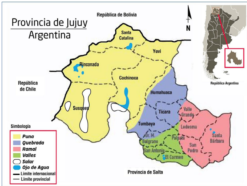
Figura 1. Regiones ambientales de la Provincia de Jujuy.