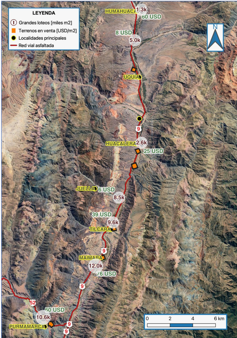
Figura 3. Terrenos en venta y grandes loteos. Quebrada de Humahuaca. Año 2023.