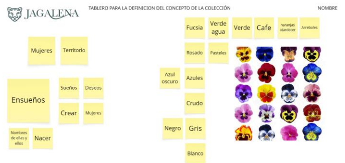
Figura 2. Tablero de ejercicios de exploración conceptual de la colección.

La esencia del proyecto no solo radica en producir una colección de pijamas, sino en reconocer el territorio, las memorias y la identidad colectiva como punto de partida para crear una marca auténtica, humana y enraizada en su comunidad.