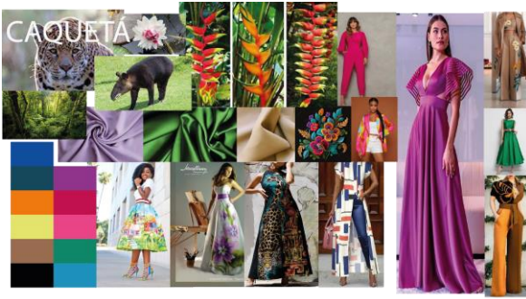
Figura 3. Moodboard de inspiración Cosemos sueños