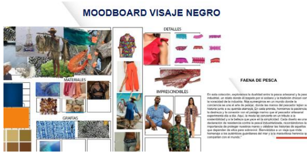
Figura 4. Moodboard de inspiración Visaje Negro