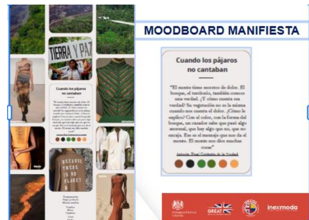
Figura 2. Moodboard de inspiración Manifiesta