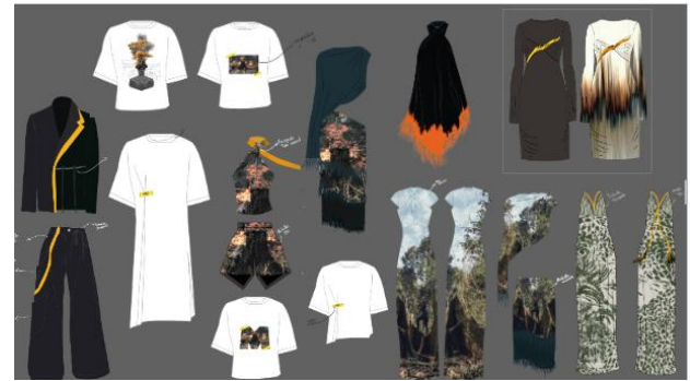
Figura 6. Colección La Línea Amarilla por Manifiesta y Natalia Rueda.